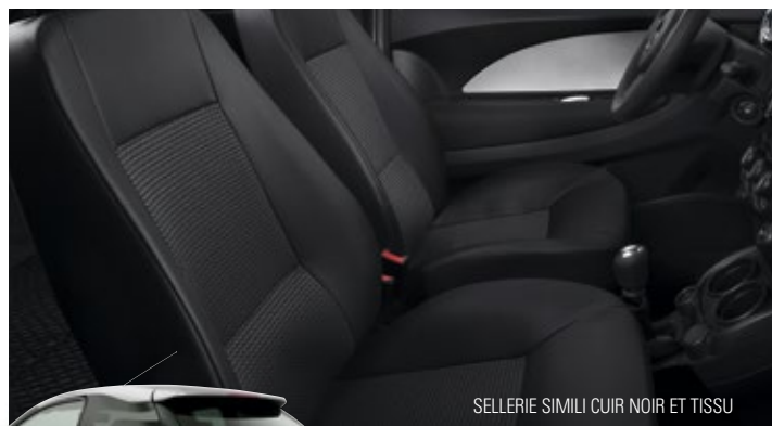
SELLERIE SIMILI CUIR NOIR ET TISSU