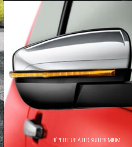
RÉPÉTEUR À LED SUR PREMIUM