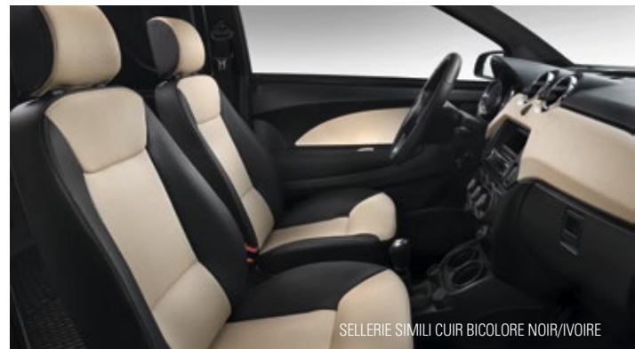
SELLERIE SIMILI CUIR BICOLORE NOIR/IVOIRE