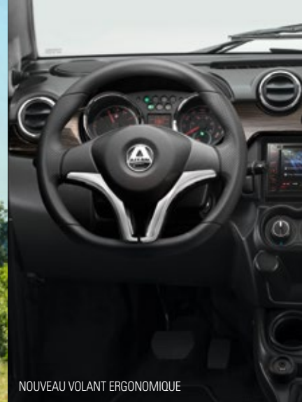
NOUVEAU VOLANT ERGONOMIQUE