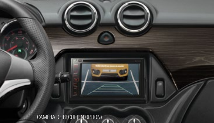
CAMÉRA DE REcul (EN OPTION)