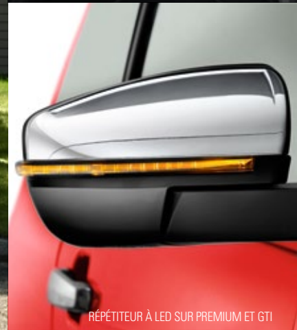
RÉPÉTITEUR À LED SUR PREMIUM ET GTI