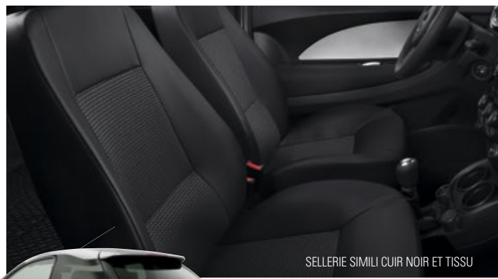
SELLERIE SIMILI CUIR NOIR ET TISSU