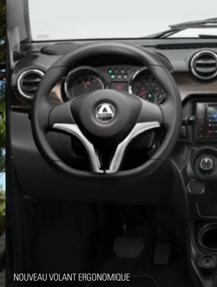
NOUVEAU VOLANT ERGONOMIQUE